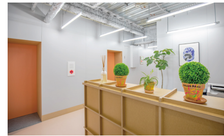
3F シェアオフィス (全部屋 家具付き個室)