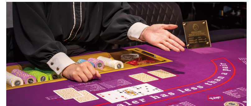
RFID搭載のポーカーテーブル

残ったチップはお店に貯めて帰ることができ、次回来店時には入場料1,000円でチップを引き出して遊ぶことができます。