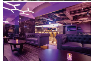
旗艦店である流川店はバー利用のみでも利用できるソファ席やダーツ、カラオケも楽しめる。VIPルームも完備。