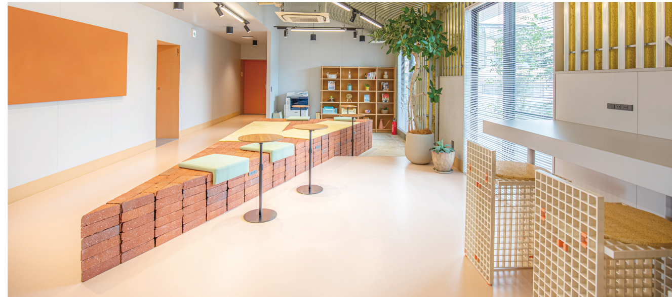
4F ラウンジスペース 入居者同士が気軽に交流したり、ワークショップやビジネスマッチングのイベントなども開催できる