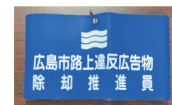
広島市の認定を受けて活動

毎月、広島本通商店街アーケード内や上安にある田中山神社の清掃活動を行っています。また、役員自らが「広島市路上違反広告物除却推進員」の資格を取得し、隔月で平和記念公園付近地域の落書き消しやシール剥がしなど、平和都市の美観保全活動に取り組んでいます。