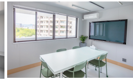
4F ミーティングルーム

全フロア全室家具付き、高速Wi-Fiや光熱費込みのシンプルで洗練されたデザインの完全個室です。パチンコホール社員寮と倉庫だった間取りをそのまま活かし、10㎡・20㎡・30㎡の3タイプをご用意。オフィスに必要な設備やサービスをシェアすることで、優れたコストパフォーマンスが実現し、創業・独立する人にもご利用いただきやすくなっています。