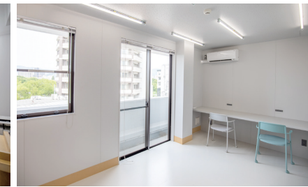
4F シェアオフィス (平和記念公園が見渡せる個室)